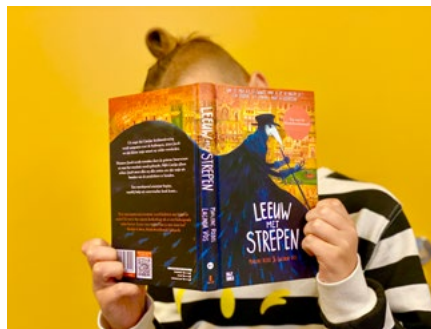
Aflevering #2.2. Arie (10) met Leeuw met strepen