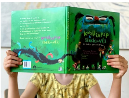
Aflevering #2 Eefke (7) met Kwallenpap en slakkenvla