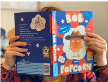
Aflevering #1 Levi (7) met Bob Popcorn