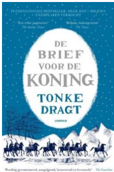
De brief voor de koning – Tonke Dragt ( jeugdbibliotheek.nl )