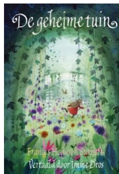
De geheime tuin - Frances Hodgson Burnett ( jeugdbibliotheek.nl )