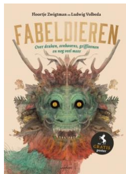
Fabeldieren – Floortje Zwigman en Ludwig Volbeda ( jeugdbibliotheek.nl )