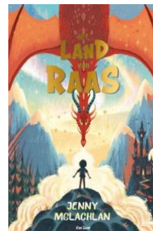
Het land van Raas – Jenny McLachlan ( jeugdbibliotheek.nl )